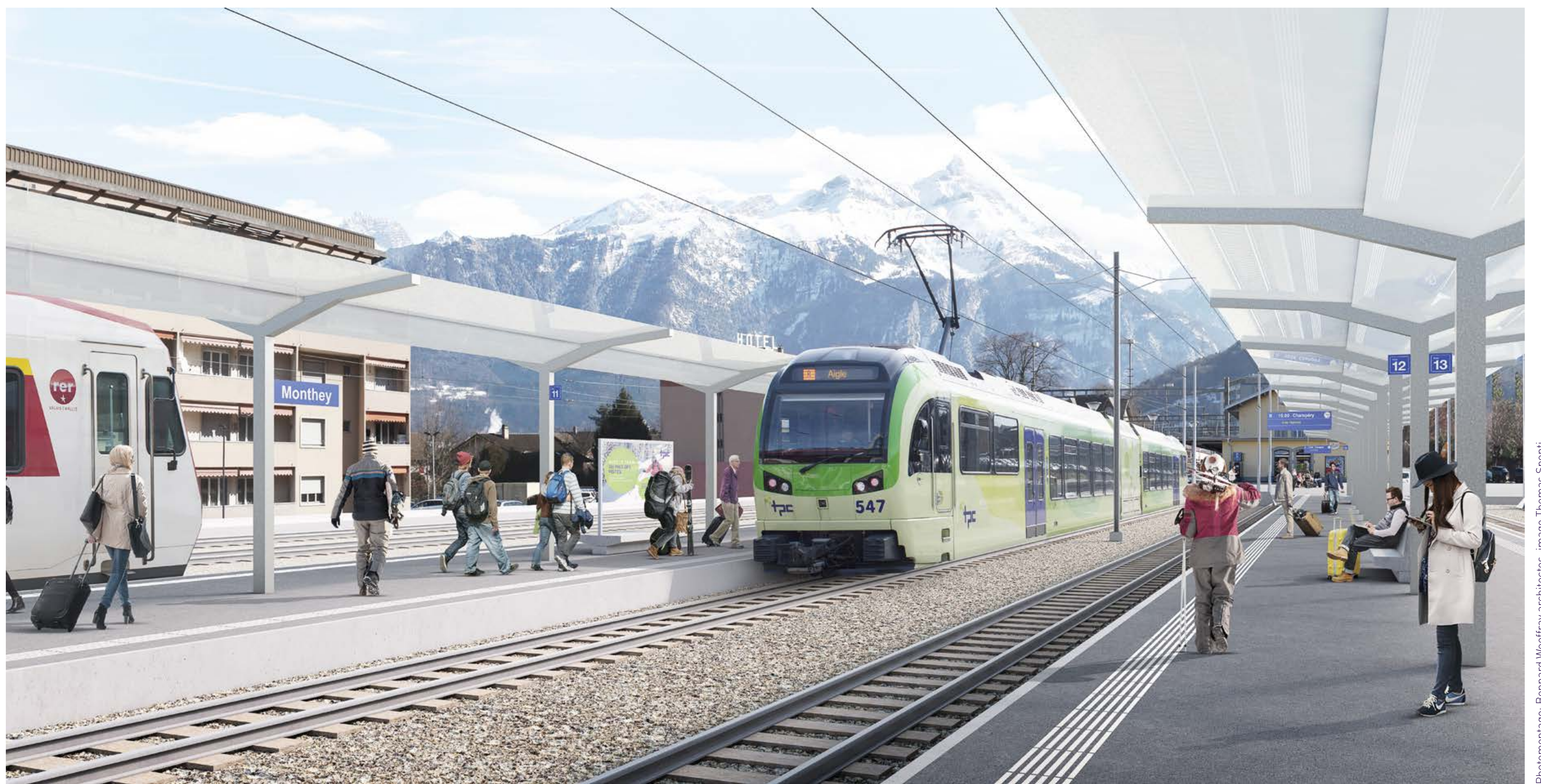
Photomontage: Bernard Hoffmeyer architects